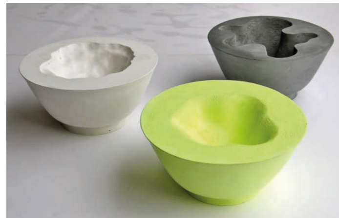
Cosmogonie, 2013 Résine, pigments, poudre d'aluminium

« La coulée remplit le vide, épouse les contours, glisse sur les parois, s'élève du fond vers la surface, rend compte et devient témoin d'une intention. Façonnée par le geste, la mémoire / matière, loin d'être immédiate, agit à rebours, elle est / devient la course permanente de toutes nos sensations. » Yves Bodiou