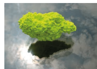
Nuage jaune soufflé, 2014 Silicone et pigments jaunes

L'exposition réunit trois sculpteurs, soit trois artistes qui travaillent avec la matière et l'espace dans une approche empirique de la genèse des formes, et ce au travers de différents médiums : la sculpture, la vidéo, le dessin et l'installation. À la recherche du mystère de l'origine et de la vie peut-être, ces artistes travaillent sur la trace laissée par les éléments, à la quête de la structure inhérente à la matière. Ils décèlent les mouvements internes qui régissent sa formation et sa transformation. Suspendues dans le temps, ces expériences issues de matériaux naturels ou synthétiques côtoient des représentations abstraites révélant un secret sur l'invisible. L'énergie qui a précédé l'apparition de la vie faite de la circulation des éléments infinitésimaux comme l'explique la science (dont le graviton), obéit aux lois de la gravité, la même force avec laquelle joue la sculpture pour s'ériger, créer une nouvelle perception de notre espace, un nouveau paysage, celui dans lequel nous gravitons nous-mêmes, au cœur de cette alchimie. S.D.