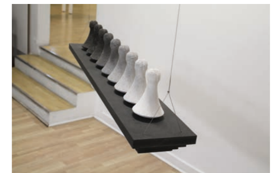
Ke'a tuki, 2012 Pilon en lave des Îles Marquises, plâtre polyester teinté, pigment noir minéral