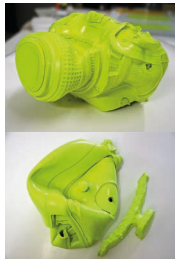
Invitation au paysage et Sans titre, 2013 Silicone et pigments jaunes

Afin d'agir dans cet espace de manière inattendue par des événements graphiques et picturaux autrement qu'utilitaires et qui conditionnent nos comportements ; il y inscrit d'autres trajectoires et la possibilité de rencontre avec l'autre pour interroger le regard et changer nos habitudes.