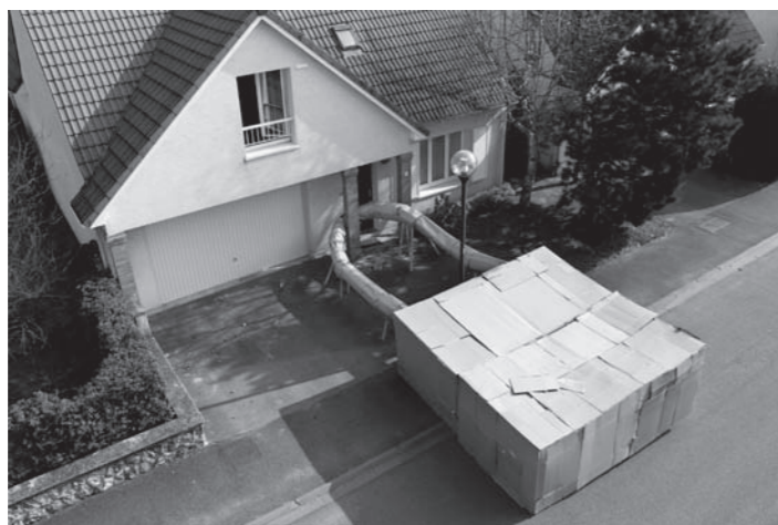
Studio 21bis, Cadenas, carton, adhésif, 2010

*Le CLEAC est un dispositif soutenu par la Ville, la Drac et l'Éducation Nationale.